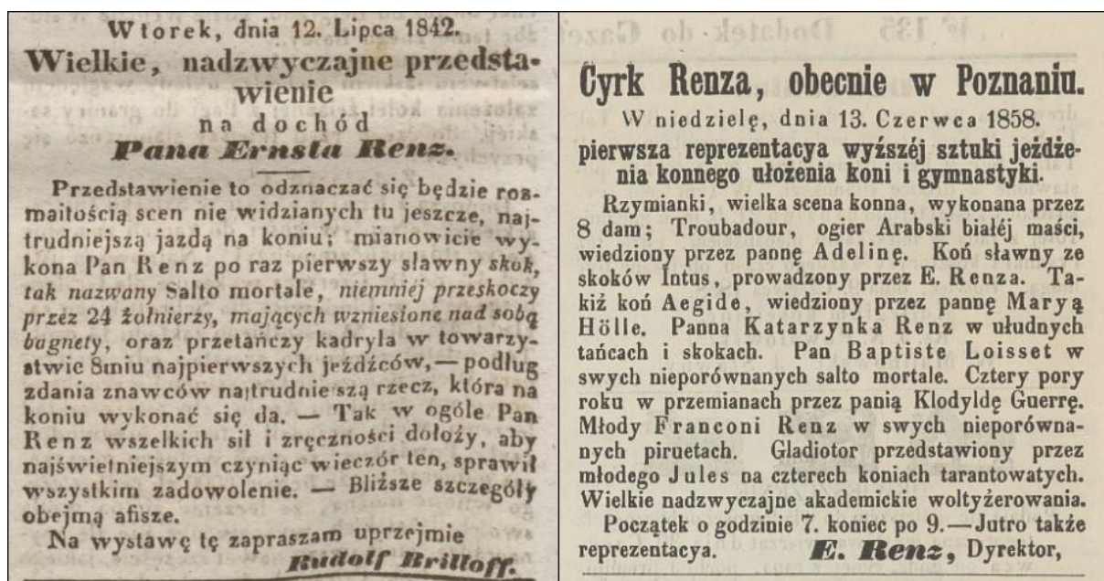
Fot. 2: Wycinki prasowe zamieszczone na łamach Gazety Wielkiego Xięstwa Poznańskiego , stanowiące źródłowe potwierdzenie uwzględnienia skoku salto mortale w repertuarze niemieckich cyrków olimpijskich (z lewej: notatka z 12 lipca 1842, s. 988; z prawej: notatka z 12 czerwca 1858, s. 6).

różnych pokazów. Swoje popisowe widowiska w jeździectwie wyższego rzędu uzupełniał najczęściej dodatkowymi elementami, na czele z pantomimami, historycznymi scenami wojskowymi w postaci prezentacji bitew i kontrmarszy, benefisami na korzyść swoich artystów, a nawet okolicznościowymi obchodami, na przykład z okazji rocznicy urodzin Fryderyka Wilhelma I. Szczególnie ważnym elementem repertuaru była demonstracja scen wcześniej niewystawianych w Poznaniu, pośród których znajdował się ‘sławny skok tak nazwany salto mortale’, co miało być według znawców sztuki cyrkowej najtrudniejszą rzeczą, którą można było ówczesnie wykonać („Gazeta Wielkiego Xięstwa Poznańskiego”, 1842).