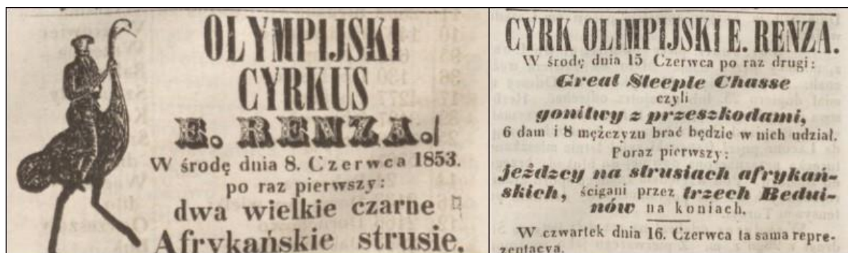
Fot. 3: Wycinki prasowe zamieszczone na łamach Gazety W. Xięstwa Poznańskiego , stanowiące źródłowe potwierdzenie pojawienia się strusiów oraz zaangażowania ich w pościgi prezentowane przez niemieckie cyrki olimpijskie (z lewej: notatka z 8 czerwca 1853, s. 3; z prawej: notatka z 15 czerwca 1853, s. 4).

możliwości poznawania świata przez Polaków, w tym także świadomość wykorzystywania ptaków do przedsięwzięć zawierających elementy sportowe, czego dowodem była prezentacja wyścigów strusi w przedstawieniu ‘Jeźdźcy na wielkich czarnych strusiach, ściganych przez trzech Beduinów na koniach’ („Gazeta W. Xięstwa Poznańskiego”, 1853a).